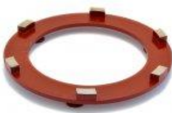
GS1 Ø 200mm (kit de 3 pièces)

Disques diamantés métalliques Ø 100mm pour le ponçage du granit à utiliser avec la LEVIGHETOR 600/640: GS0 -GS1 -GS2