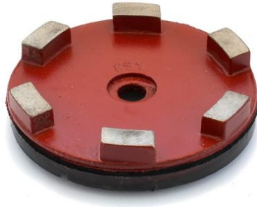
GS1 Ø 100mm (kit de 3 pièces)

Disques diamantés métalliques Ø 100mm pour le ponçage du granit à utiliser avec la LEVIGHETOR 600/640: GS0 -GS1 -GS2